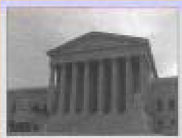
Supreme Court Building, Washington D.C.

La prueba al azar de la droga de la orina de un atleta interscholastic de la escuela pública es legal según lo determinado por el Tribunal Supremo de Estados Unidos en el caso de Vernonia School District 47j (Oregon) v. Wayne and Judy Acton . Las pruebas al azar de la droga de la orina de los estudiantes extracurricular de la actividad de las escuelas públicas son legales según lo determinado por Pottawatomie County Independent School District #94 vs. Earls . Los estudiantes conforme a la prueba deben ser determinados por el tablero de la escuela basado sobre estos dos actos del Tribunal Supremo.